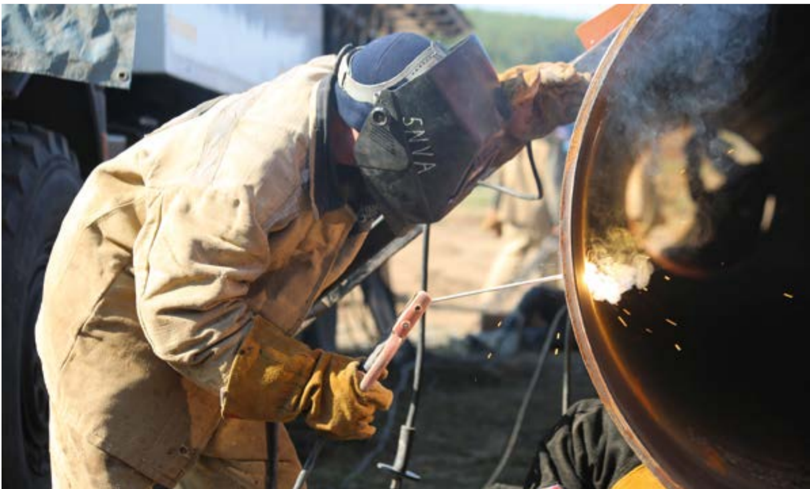
Комплексный ремонт технологических трубопроводов в Шаранском ЛПУМГ

По мере роста объемов выполняемых работ на магистральных газопроводах, проходящих через Башкирию, структура «Баштрансгаза» расширяется за счет создания новых подразделений. 7 апреля приказом по Министерству образовано Полянское ЛПУМГ, которое будет обслуживать магистральные газопроводы Челябинск–Петровск, Уренгой–Петровск, Уренгой–Новопсков. В его составе появятся сразу три компрессорных цеха: КС-4, КС-17, КС-17А.