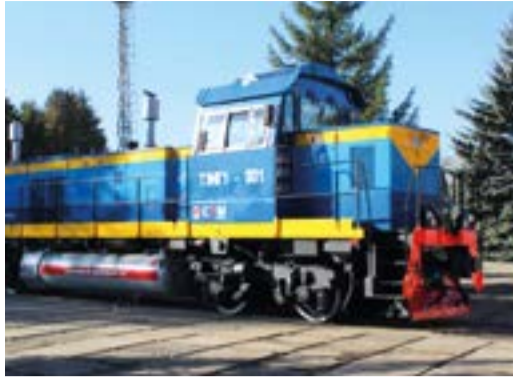
Маневровый тепловоз модели ТЭМГ1

ООО «Газпром нефтехим Салават» планирует закупить тепловозы, работающие на сжиженном природном газе. Компания заключила соглашение с АО «Синара – Транспортные Машины» о поставке 12 маневровых тепловозов модели ТЭМГ1 мощностью 1200 л. с., использующих в качестве топлива СПГ. Новые локомотивы имеют большие перспективы из-за использования более экономичного и экологичного газомоторного топлива. Например, с учетом даже самых строгих норм по вредным выбросам Stage 3В газотурбовоз имеет двукратный запас для их соблюдения.