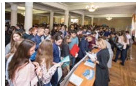
ШАГ В БУДУЩЕЕ стр. 7