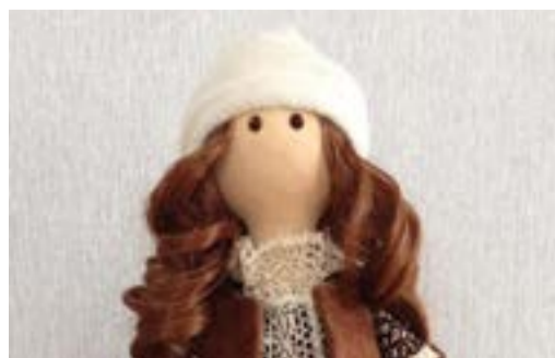
ТВОРЧЕСТВО В ДЕТАЛЯХ стр. 6