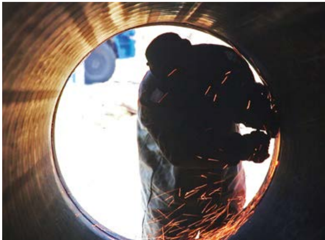
Огневые работы на МГ Уренгой–Петровск

На финишной прямой – подготовка объектов и оборудования к работе в условиях пиковых нагрузок осенне-зимнего периода. Это одно из основных направлений в годовом цикле работ газотранспортного предприятия.