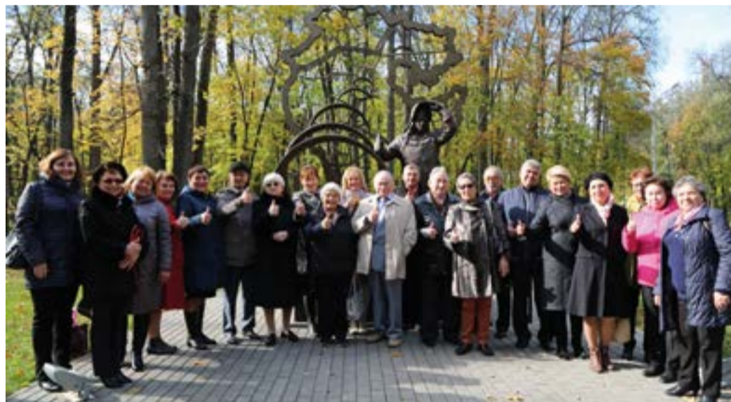
Ветераны по достоинству оценили новый арт-объект

ла подготовлена культурно-развлекательная программа «Назад в СССР». Гости вновь окунулись в молодость: вспомнили клятву пионера и повязали галстуки. Успели ветераны спеть любимые песни, потанцевать, поздравить коллег, отметивших в этом году юбилей.