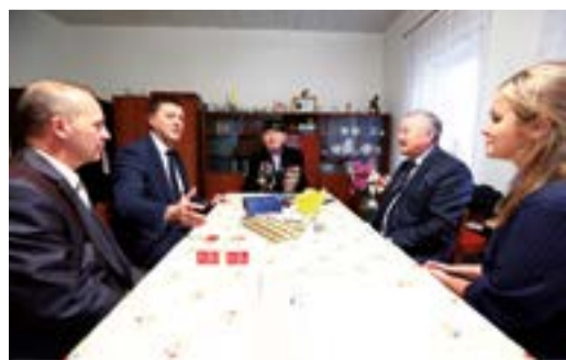
ЧАСТИЦА ПАМЯТИ стр. 3