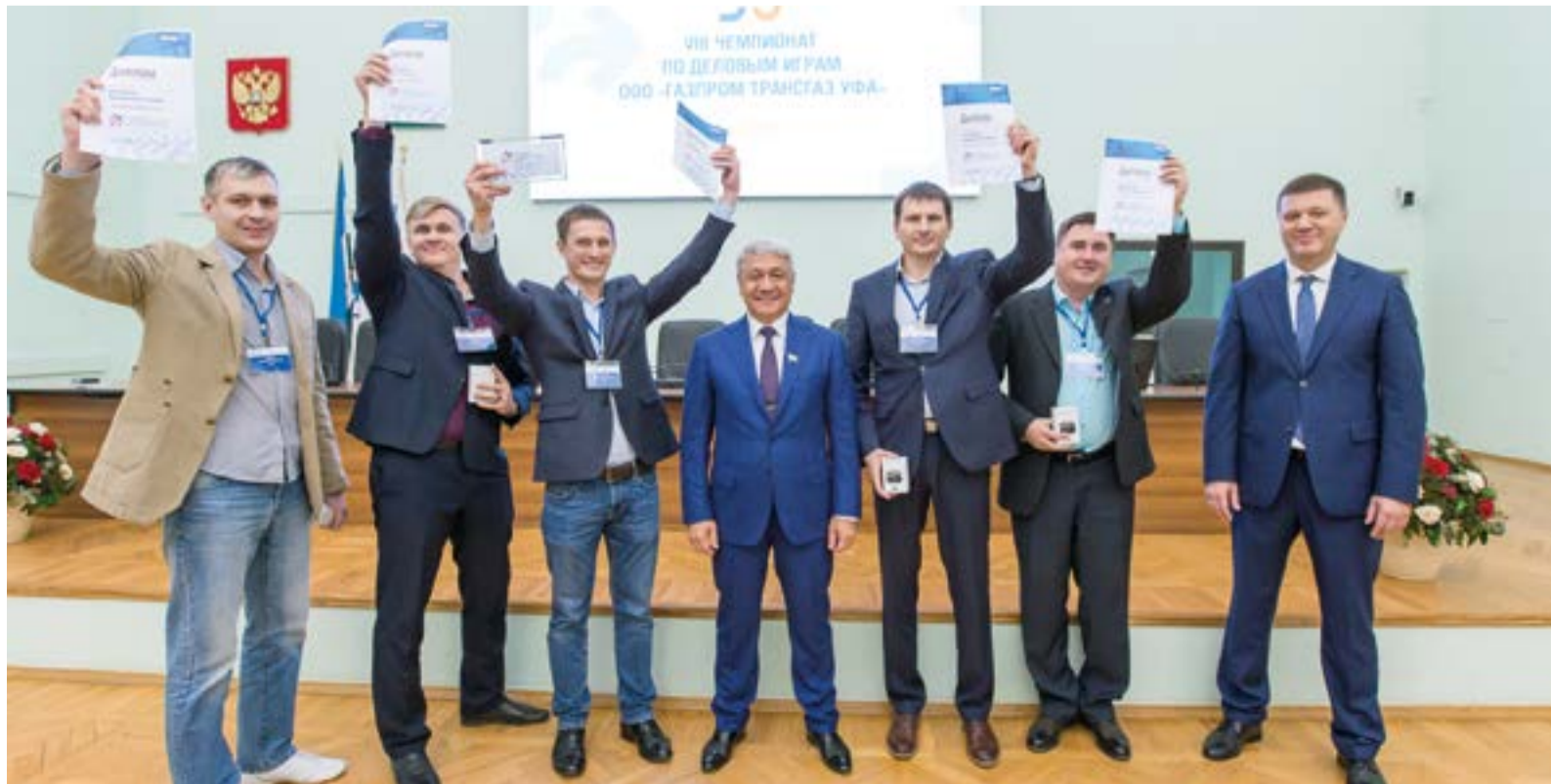
Салаватские нефтехимики – победители чемпионата