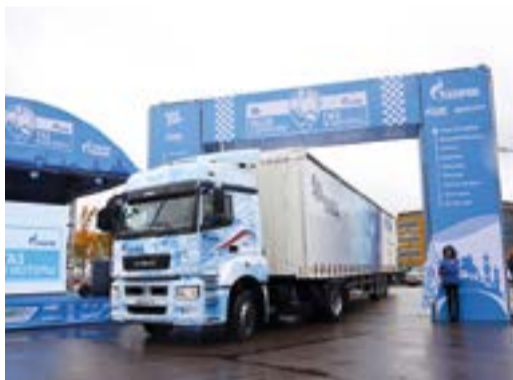
Финиш автопробега «Голубой коридор – газ в моторы 2019» в Санкт-Петербурге

В Санкт-Петербурге состоялся торжественный финиш автопробега «Голубой коридор – Газ в моторы 2019». Мероприятие стало одним из ключевых в рамках IX Петербургского международного газового форума. Участники европейского и российского этапов преодолели в общей сложности более 8 тыс. км. В автопробеге участвовали пассажирские, грузовые и легковые транспортные средства, использующие в качестве топлива компримированный и сжиженный природный газ. Газовая техника подтвердила высокую надежность и продемонстрировала экономическую эффективность газомоторного топлива. В частности, на российском этапе расходы на заправку природным газом были в 2-3,5 раза ниже по сравнению с использованием традиционных видов топлива.