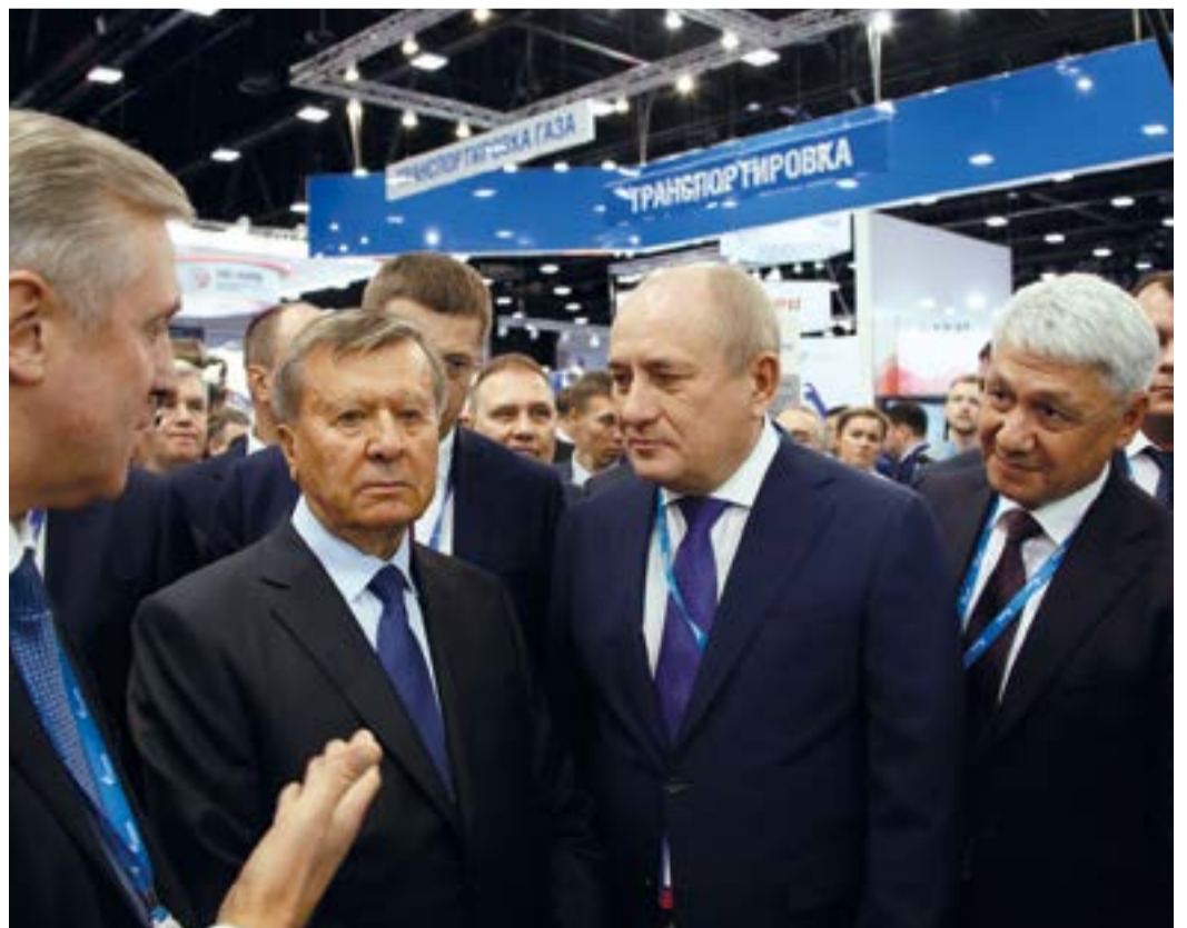
Руководство компании высоко оценило совместные разработки