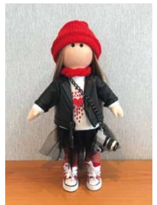
Каждая кукла имеет стильные аксессуары