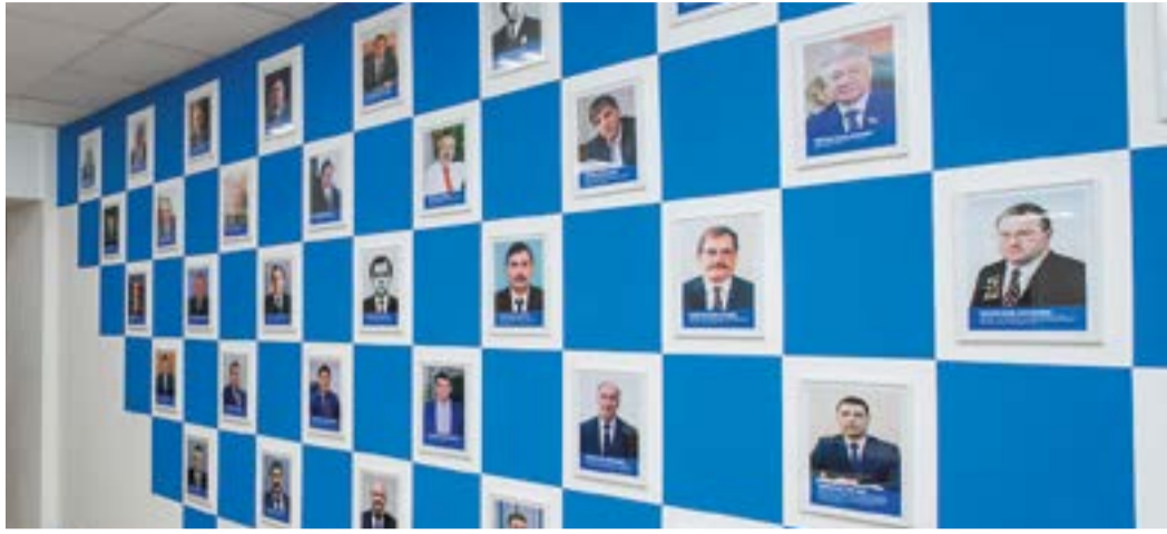
Стенд с именитыми выпускниками УГНТУ из числа руководства ПАО «Газпром» и дочерних обществ в библиотеке вуза

Октябрь ознаменован еще одной праздничной датой. День учителя – символ признательности и уважения к педагогам, их самоотверженному труду и бескорыстной заботе. Мы с благодарностью и теплотой вспоминаем своих преподавателей, уроки которых ведут нас по жизненному пути.