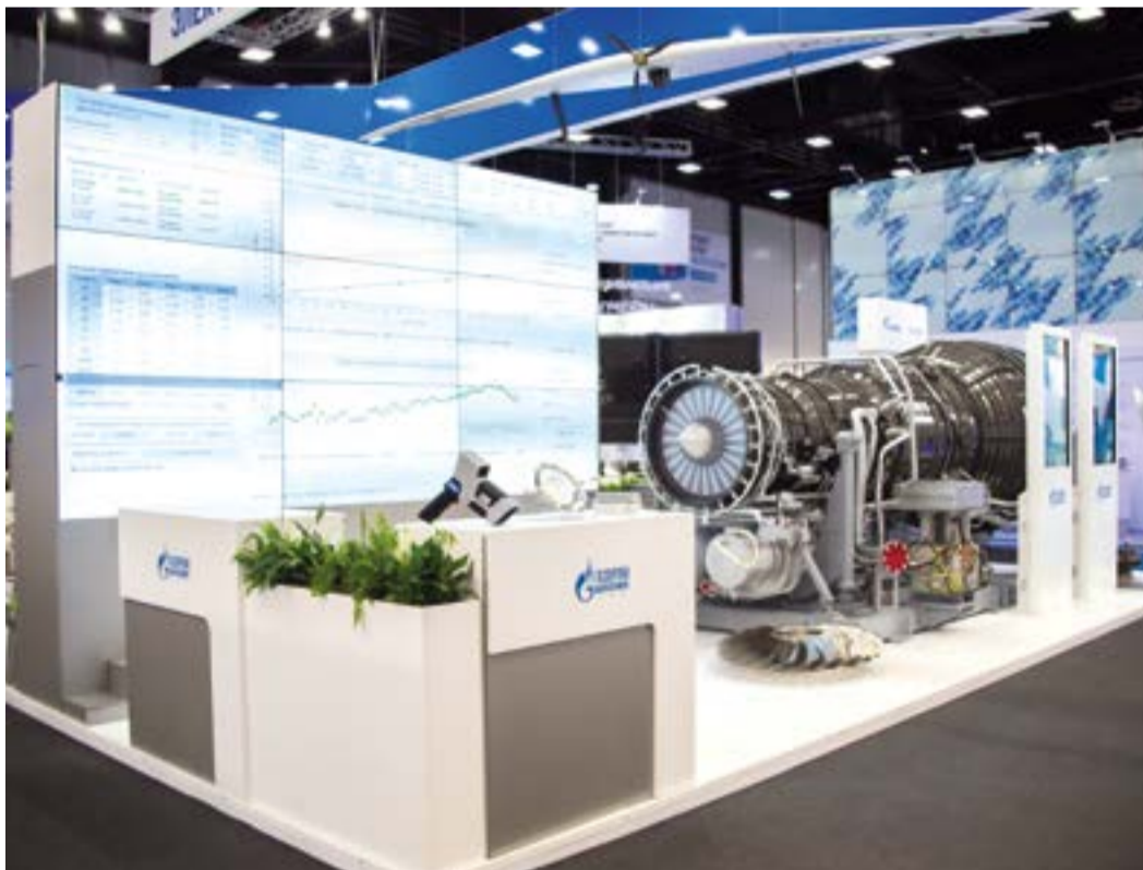
Ключевой элемент экспозиции – двигатель АЛ-41СТ-25

На площадках «Экспофорума» разместилось множество экспозиций, отражающих различные аспекты газовой индустрии. Выставка «Современные отечественные технологии в газовой отрасли» представила инновационные разработки ряда компаний.