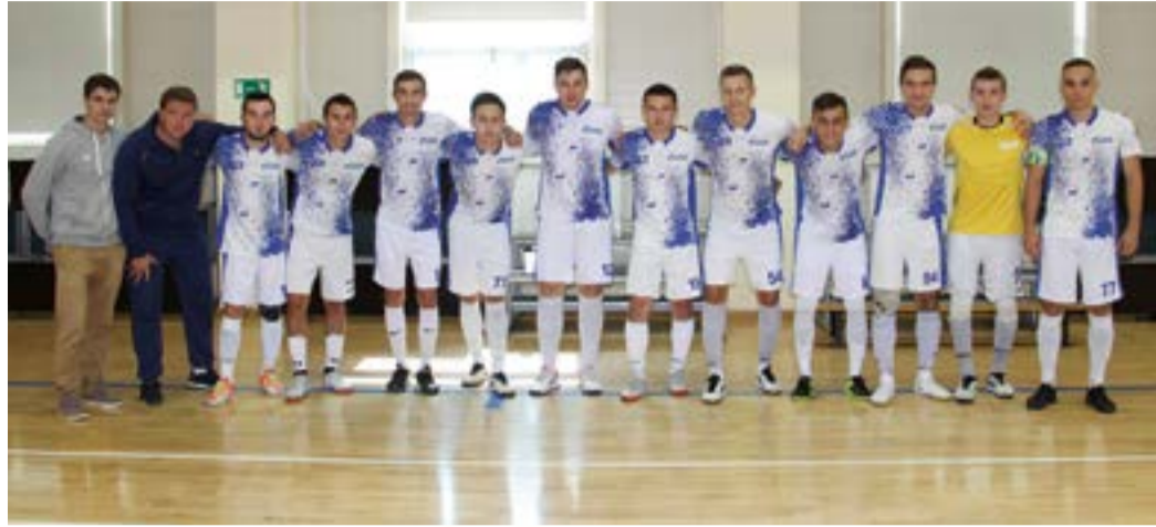
Уфимские «витязи» достойно выступили на региональном этапе Кубка России

В Уфе прошел финальный раунд регионального этапа Кубка России по мини-футболу – 2019/20. По его итогам столичный «Витязь-ГТУ» вышел в плей-офф турнира, где сыграет с клубом из Суперлиги отечественного чемпионата. Им станет «Новая Генерация» из Сыктывкара.