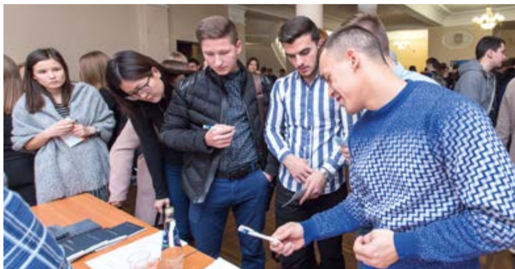
Ярмарка вакансий ПАО «Газпром» вызвала живой интерес у студентов