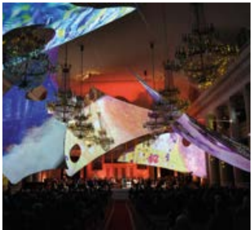
Представление стало главным культурным событием IX ПМГФ

В Большом зале Санкт-Петербургской академической филармонии им. Д. Д. Шостаковича состоялось музыкально-визуальное представление «Имперские столицы: Санкт-Петербург – Вена. XX век». Мероприятие проведено в рамках совместного культурного проекта ПАО «Газпром» и австрийской компании OMV AG. Произведения прославленных композиторов двух стран прошлого столетия исполнили Государственный симфонический оркестр «Новая Россия» под руководством Юрия Башмета и ведущие российские и австрийские исполнители. Зал филармонии украсили проекции картин известнейших художников России и Австрии XX века из коллекций музеев Санкт-Петербурга и Вены. Композицию дополнили исторические кадры из жизни двух городов в минувшем столетии. Концерт посетили более тысячи гостей.