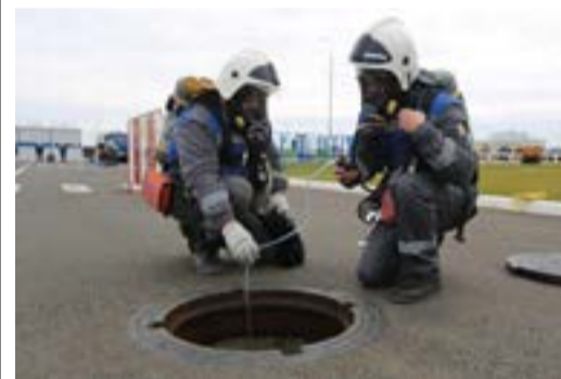
Демонстрация эвакуации пострадавшего из колодца

На базе Управления аварийно-восстановительных работ состоялась аттестация штатного аварийно-спасательного формирования (НАСФ) — газоспасательной группы ООО «Газпром трансгаз Уфа» на право ведения газоспасательных работ. Процедура проверки соответствия проводилась рабочей группой объектовой комиссии Минэнерго России по аттестации аварийно-спасательных формирований и спасателей ПАО «Газпром».