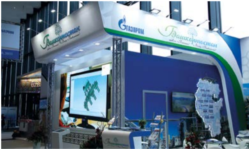
Стенд Республики Башкортостан впервые представлен на ПМГФ

Многогранность и единство команды, деятельность которой направлена на развитие газовой отрасли, нашли отражение на стенде региона. Олицетворением масштабной инфраструктуры компаний, эффективного взаимодействия стал образ города, который был