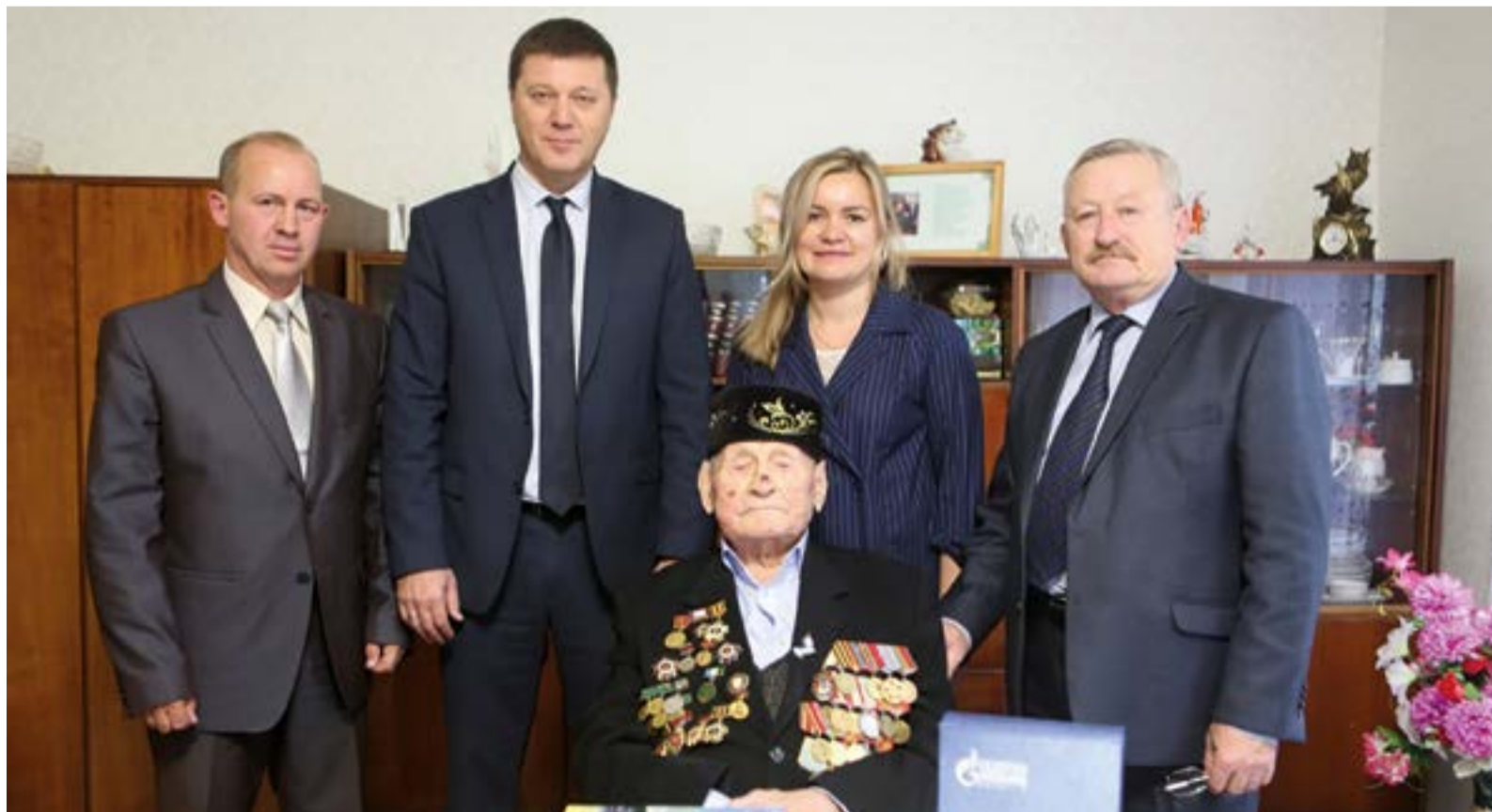
День уважения защитнику Брестской крепости