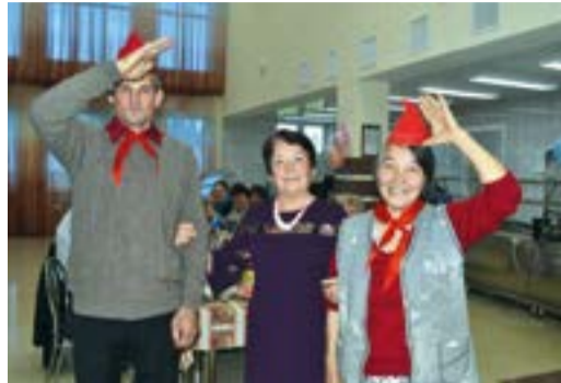
В Ургалинском ЛПУМГ состоялся тематический праздник

1 октября пенсионеры и ветераны ООО «Газпром трансгаз Уфа» собрались вместе, чтобы в теплой и дружеской атмосфере отпраздновать Международный день пожилых людей. Ставшее уже традиционным мероприятие в этом году собрало более 300 человек.