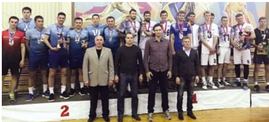
Церемония вручения наград победителям и призерам открытого Чемпионата г. Уфы прошлого сезона

Волейболисты предприятия имеют серьезный потенциал: «серебро» в финале