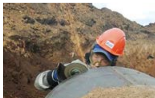
ЗАКРУГЛЯЕМСЯ стр. 2